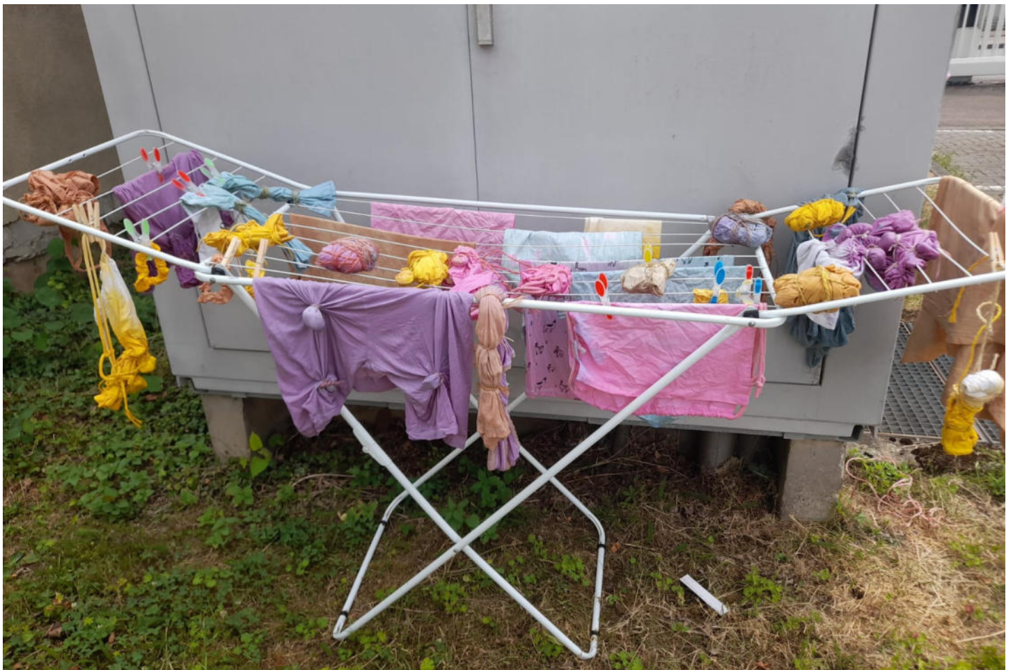
*Natürliches Färben von hellen (Baumwolle-)Textilien mit Lebensmitteln; 27.06.2023